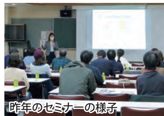
昨年のセミナーの様子