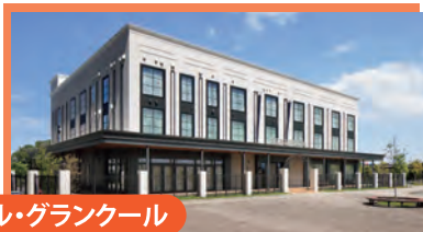
ル・グランクール

各施設の会員特典については、4月に送付した会員特典一覧やホームページをチェックしてくださいね!